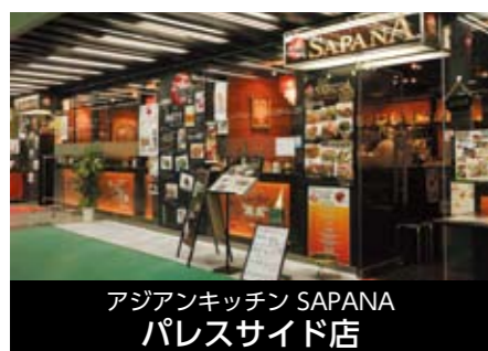
アジアンキッチン SAPANA パレスサイド店

〒162-0825 東京都新宿区神楽坂2-6 porta神楽坂 TEL 03-5228-3717 FAX 03-5228-3717