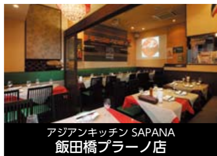
アジアンキッチン SAPANA 飯田橋プラザ店

〒102-0071 東京都千代田区富士見2-2-11 富士見ヨシダビル1F TEL 03-5215-7007 FAX 03-5215-7007