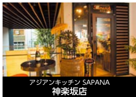
アジアンキッチン SAPANA 神楽坂店

〒102-0071 東京都千代田区富士見2-7-2 飯田橋プラザノモール2F Cゾーン TEL 03-3556-3676 FAX 03-3556-3676