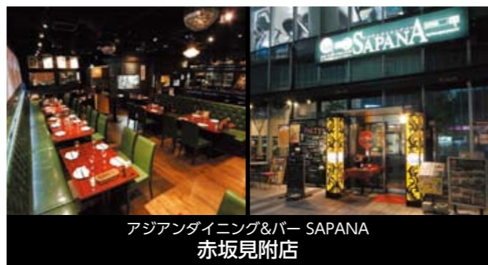
アジアンダイニング&バー SAPANA 赤坂見附店

〒101-0061 東京都千代田区三崎町2-20-8 FUNDES水道橋1F TEL 03-3512-3970