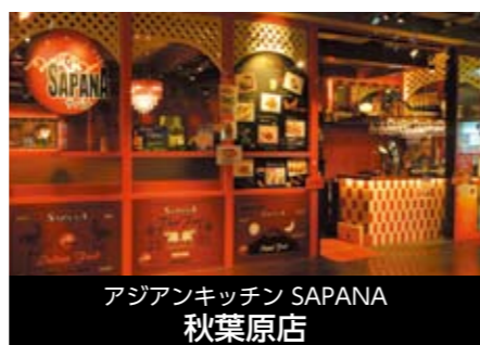
アジアンキッチン SAPANA 秋葉原店

〒130-0013 東京都墨田区錦糸1-2-47 錦糸町ステーションビル(ターミナル) TEL 03-3625-7885