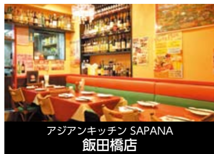
アジアンキッチン SAPANA 飯田橋店

〒102-0071 東京都千代田区富士見2-2-11 富士見ヨシダビル1F TEL 03-5215-7007 FAX 03-5215-7007