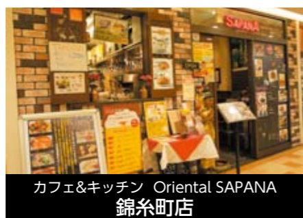
カフェ&キッチン Oriental SAPANA 錦糸町店

〒100-0003 東京都千代田区一ツ橋1-1-1 パレスサイドビル TEL 03-6269-9447 FAX 03-6269-9447