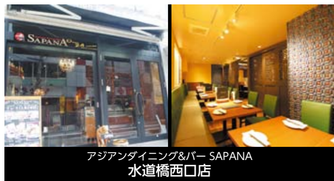
アジアンダイニング&バー SAPANA 水道橋西口店

〒101-0021 東京都千代田区外神田4-14-1 秋葉原UDXビル2F TEL 03-3527-1771